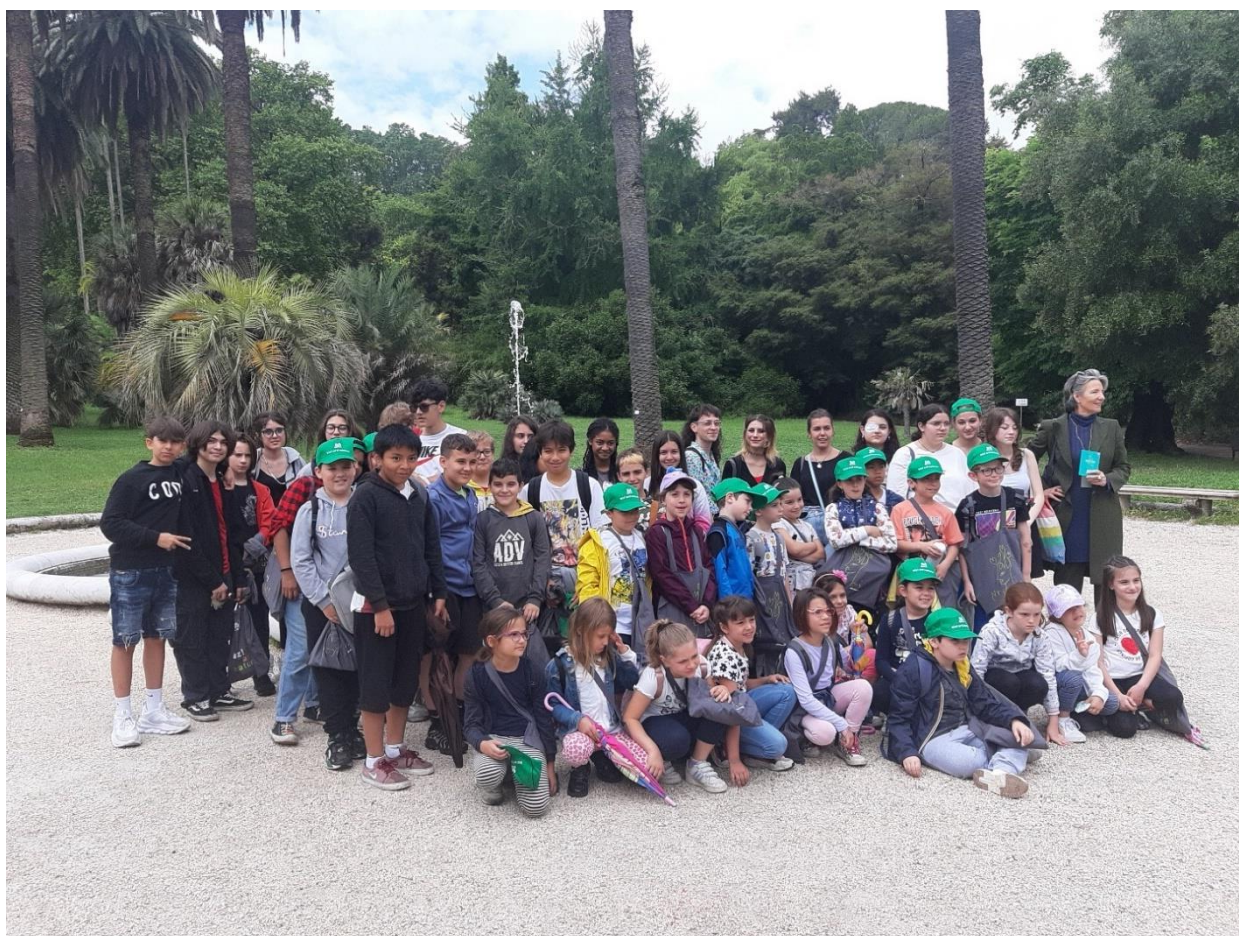
5 giugno 2023, gli studenti all'Orto Botanico di Roma