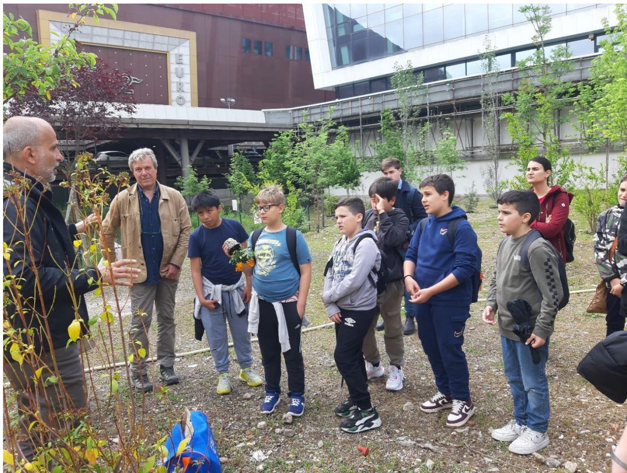
18 maggio 2023 ,gli alunni della 1^C ascoltano la storia del "Bosco transitorio"